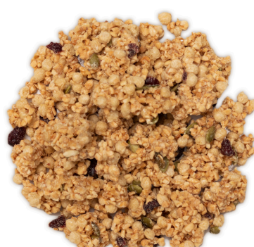
Low carb - Original