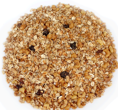
Tradicional sem açúcar