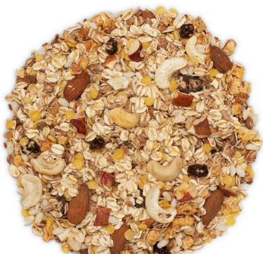
Sem glúten, sem açúcar