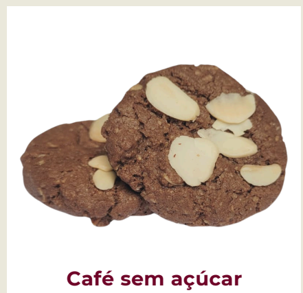
Café sem açúcar