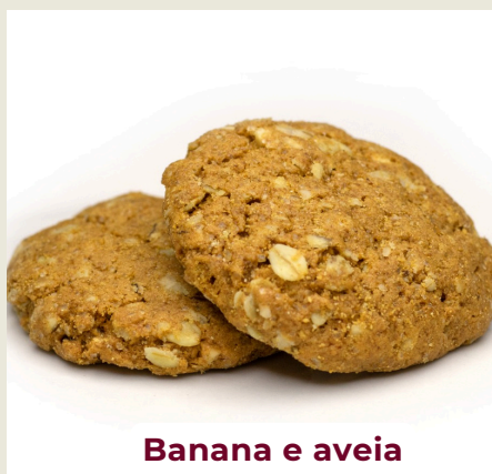
Banana e aveia