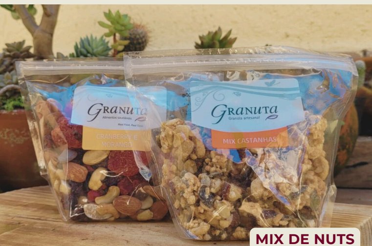
MIX DE NUTS