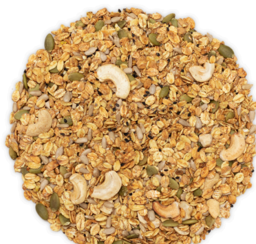
Salgada - Lemon pepper