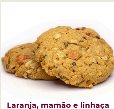
Laranja, mamão e linhaça