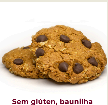
Sem glúten, baunilha